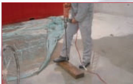
Extrem leichtsinnig: im Wasser stehen und mit kaputter, selbst geflickter Leitung arbeiten. Der Körperwiderstand sinkt und die Gefahr einer Durchströmung erhöht sich enorm.

Noch mehr zum Thema Strom, seine Wirkung auf den Körper, richtige Schutzmaßnahmen, notwendige Kennzeichnungen und vieles mehr können Sie auf den Seiten 12 und 13 dieser AREIT UND GESUNDHEIT lesen!