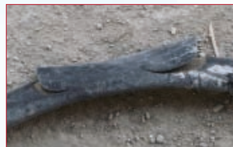
... die nach einiger Zeit dann so aussehen.