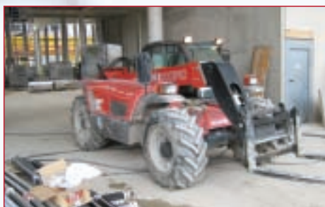
Das hält die stärkste Leitung nicht aus: Dieses Baustellenfahrzeug rollt ganz entspannt über Stromleitungen, ...